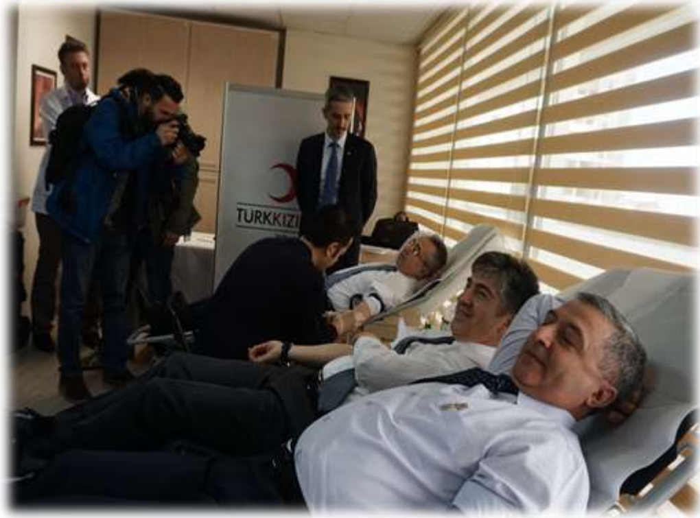
Kan Bađışında bulunan alıřanlarımıza verilen teřekkür belgesi.